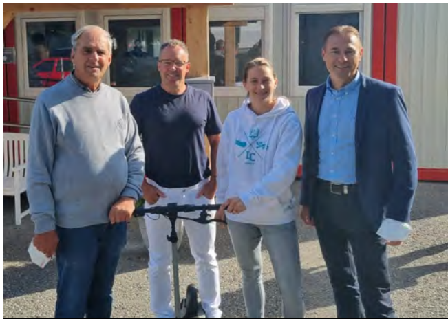
Bei der Auftaktveranstaltung zu Liebenfels impft, freute sich der glückliche Gewinner über einen E-Scooter.

Auf Grund der großen Nachfrage am ersten Impftermin im September, gab es weitere Termine und wurde die Aktion bis Donnerstag, 23.12.2021 (letzter Impftag) verlängert und in das Kulturhaus Liebenfels verlegt.